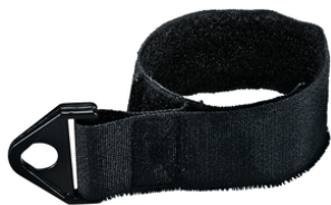
166116-2 Bevestigingsband rugstofzuiger