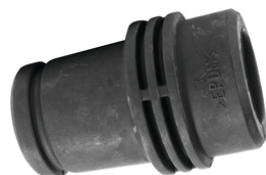
424379-9 Koppeladapter 35/25 ribbed