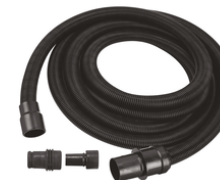
195436-7 Stofzuigerslang 28x5000mm