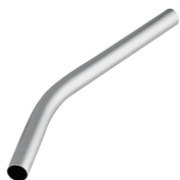
192562-3 Handgreep zuigbuis aluminium