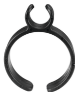
417764-3 Kabelhouder stofzuigerslang