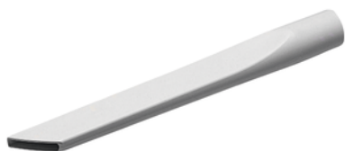
410306-2 Kierzuigmond lang ivoor wit