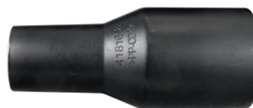
195548-6 Koppeladapter 38x25/22mm