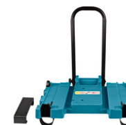
198599-8 Mbox houder stofzuiger