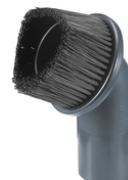
191657-9 Plumeau zwart